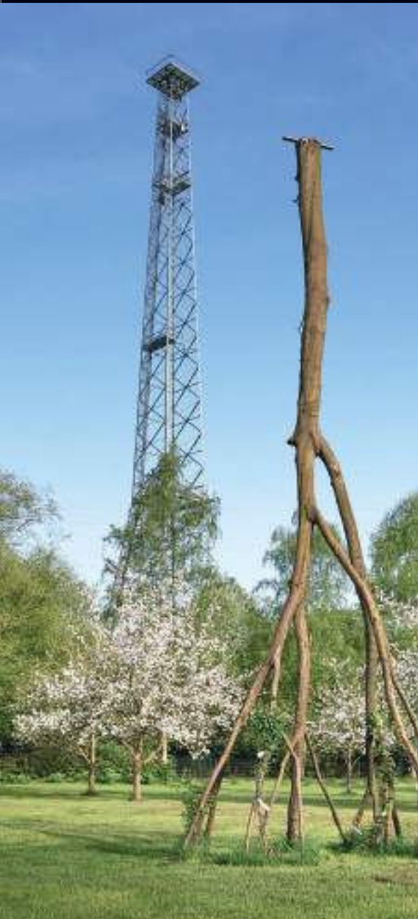
Roman Mensing – Kopfstand