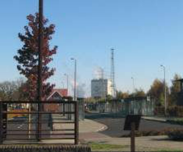
Ludwig Middendorf – Viehrampe