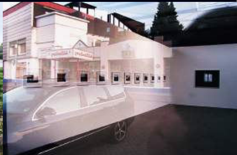
Wilhelm Gelhaus Berges – Fotoausstellung