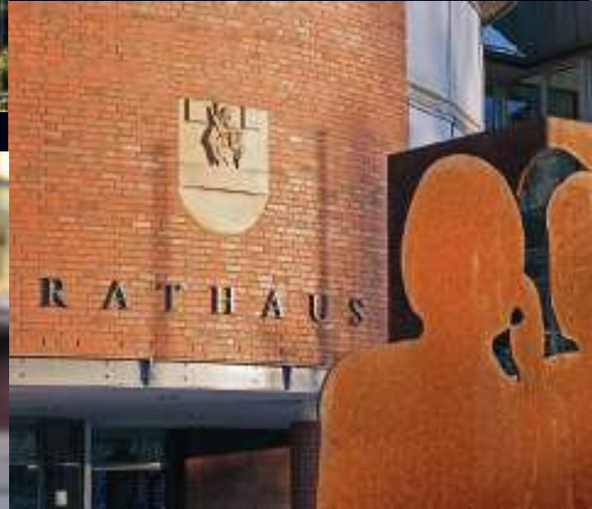
Derk van Groningen – Rathaus Cloppenburg