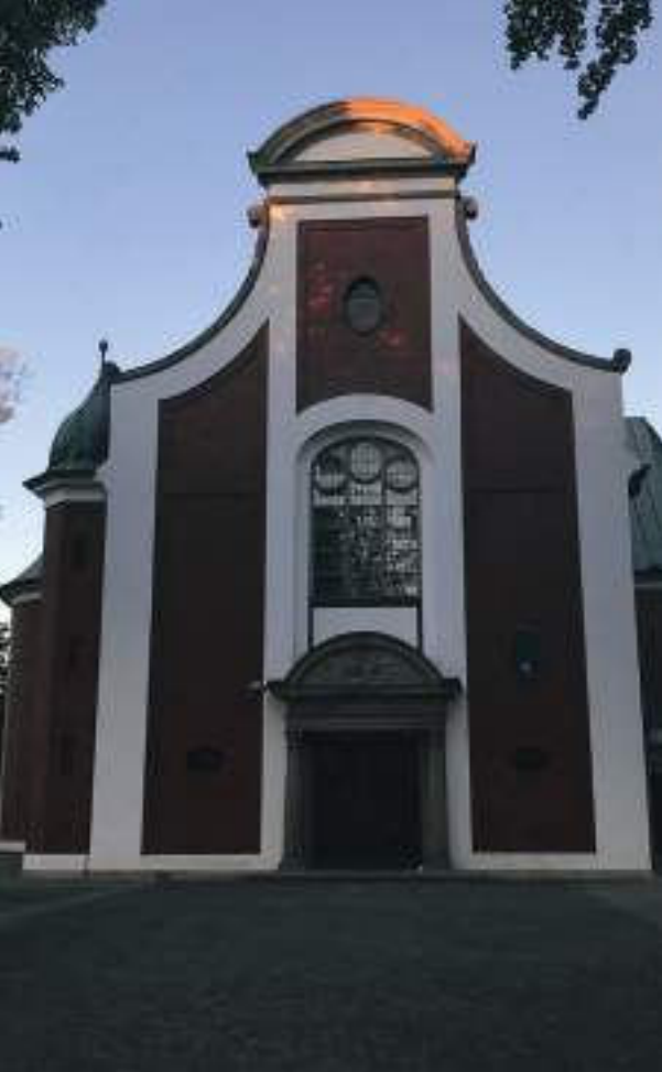
Friederike Bockhorst – Bethen