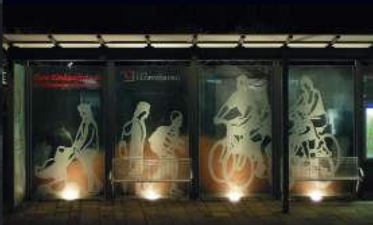
Derk van Groningen – Bushaltestelle am Marktplatz